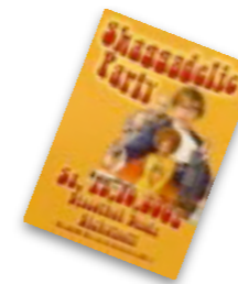
Ihr bestehender Flyer im DIN-Format

Wenn Sie keine Zeit und kein Geld in das Umgestalten Ihres bestehenden Werbeflyers investieren möchten, wir Ihr Flyer automatisch skaliert. Senden Sie uns einfach Ihre vorhanden Grafik per E-Mail zu. Der Flyer wird dann vom System auf die bestmöglichen Formate angepasst. Formate bei denen Ihr Flyer nicht gut aussieht werden von uns deaktiviert. So erhalten Sie immer das beste Ergebnis.